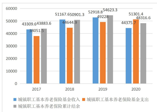
图2 2017年至2020年城镇职工基本养老保险基金收支情况(单位:亿元)

第五，增值保值效果不明显。图表2展示了2017年至2020年城镇职工基本养老保险基金收支情况，2020年我国城镇职工基本养老保险基金收入为44375.7亿元，支出为51301.4亿元，累计结余为48316.6亿元。从图2可以看出，我国城镇职工基本养老保险基金收入总体呈现逐年递增的趋势，但是在2020出现了一个明显的下降。作为管理城镇企业职工养老金的经办机构，要落实基金增值保值的责任。我国养老基金投资渠道单一，收入率低，就目前来看，主要途径是存银行和购买国债。养老金也是钱，钱会贬值，因此单一的依靠存款或者是购买债券肯定是不行的。