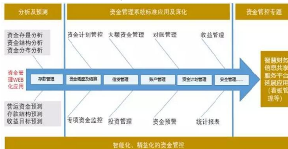
图1 医院财务信息化系统

此外, 随着“互联网+健康医疗”的逐步深入, 各种创新应用的涌现在很大程度上改变了人们的就医体验。如电子健康卡, 通过三码融合, 实名就医和医疗健康服务一卡和一码通, 电子健康卡与电子医保卡、电子银行卡等进行了集合应用, 可依托区域共享网络支付平台充分优化传统的就医流程, 实现了线上医保移动结算与自费部分的一次性结清, 为患者的就诊提供诸多便捷。同时, 应用自助设备、人脸识别技术, 可在就诊费用结算时直接通过人脸识别进行费用结算, 不再需要进行窗口排队费用结算。自助设备中包括了智能感知、人脸识别移动终端及云系统平台等多个模块, 将人脸识别移动终端与云系统平台连接起来, 可通过数据采集, 识别到患者信息后进行就诊费用结算。